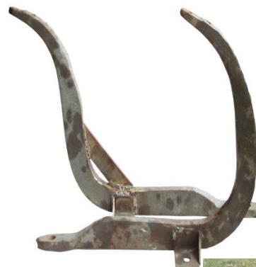
43. Навесен Браздилник 1.50