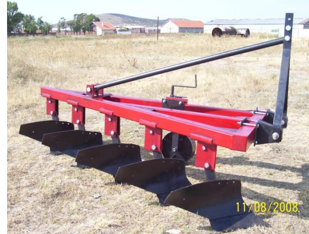
58. Навесен плуг 2х20